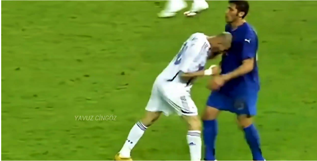
Şekil 2.4. Anti Fair Play Örneği 2