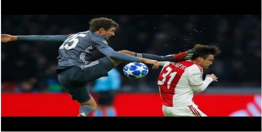
Şekil 2.3. Anti Fair Play Örneği 1