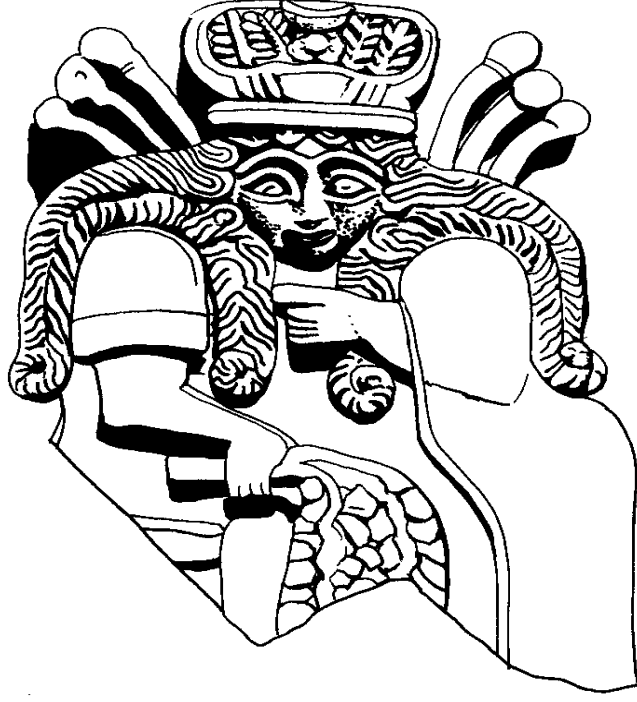
EK 10. Tanrıça Ninursag Erken Hanedanlık Dönemi'ne tarihlendirilen bir kap üzerinde. (Black, Jeremy, vd., The Literature of Ancient Sumer , s.328.)