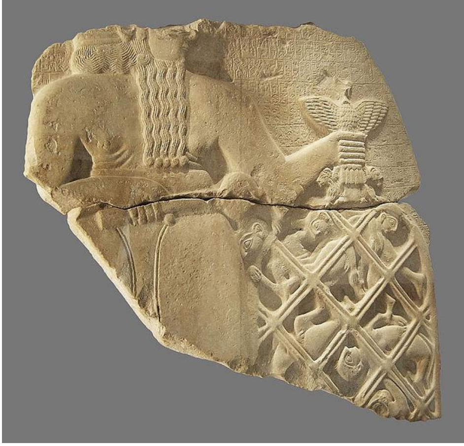
EK 5. Tanrı Ningirsu'nun düşman askerlerini bir ağ içine tutarken betimleyen Akbabalar Steli'nin ön yüzü (Louvre müzesinde sergilenmektedir.)