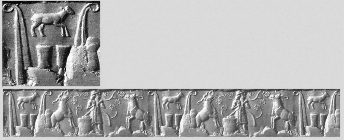
EK 8. Tanrıça İnanna'nın Uruk Dönemi silindir mühüründeki sembolü. (Rodrigo, Cabrera, "The Three Faces of İnanna: An Approach to Her Polysemic Figure in Her Descent to the Netherworld", Journal of Northwest Semitic Languages , 44/2, s.49.)