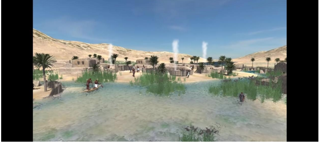
EK 3. Sidney Üniversitesi tarafından hazırlanan Uruk Dönemi'nde günlük yaşam isimli simülasyondan. ( https://www.youtube.com/watch?v=Z5HFQvx0u2c [Erişim 08.06.2022])