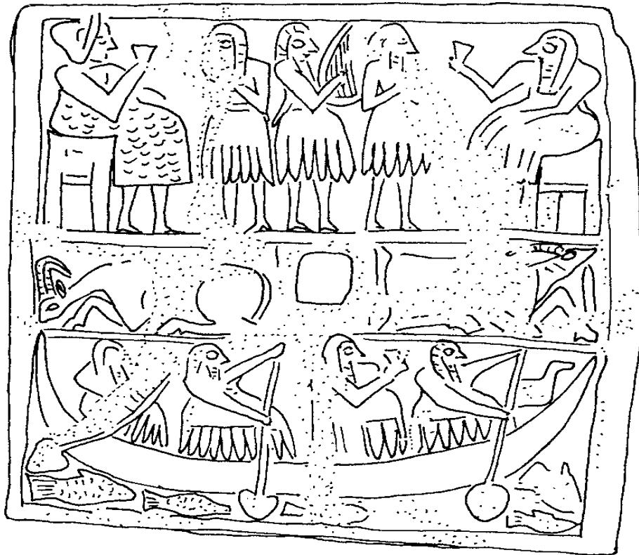
EK 7. Ay tanrısı Nanna'nın teknesi ile yapılan bir yolculuk ve bir ziyafetten önceki durumu tasvir eden taş levha. Erken Hanedanlar Dönemi Nibru. (Jeremy Black, vd., The Literature of Ancient Sumer , Oxford University Press, New York 2004, s.150.)