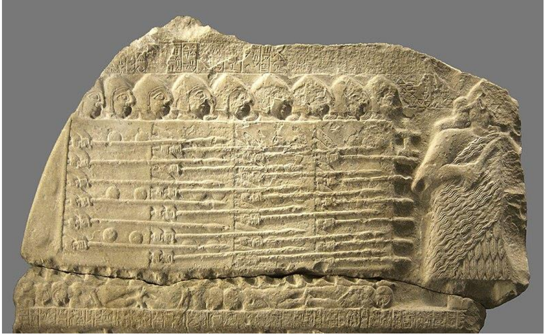
EK 6. Kral Eanatum'u ordusunun önünde betimleyen Akkabalar Steli'nin arka yüzü. (Louvre Müzesi'nde sergilenmektedir.)