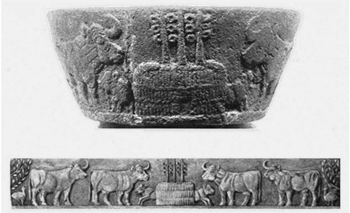
EK 9. Giginu adı verilen kutsal evlilik töreninin gerçekleştiği düğün evinin oyma taş vazo üzerindeki bir tasviri. Heface tapınağından ((Rodrigo, Cabrera, "The Three Faces of İnanna: An Approach to Her Polysemic Figure in Her Descent to the Netherworld", Journal of Northwest Semitic Languages , 44/2, s.51.)