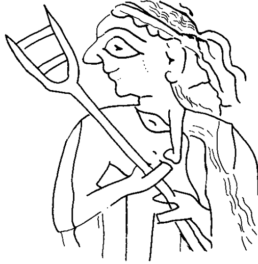
EK 4. Bir kadın tarım işçisi. Erken Hanedanlar Dönemi'ne tarihlendirilmektedir. (Black, Jeremy vd., The Literature of Ancient Sumer , s.288.)