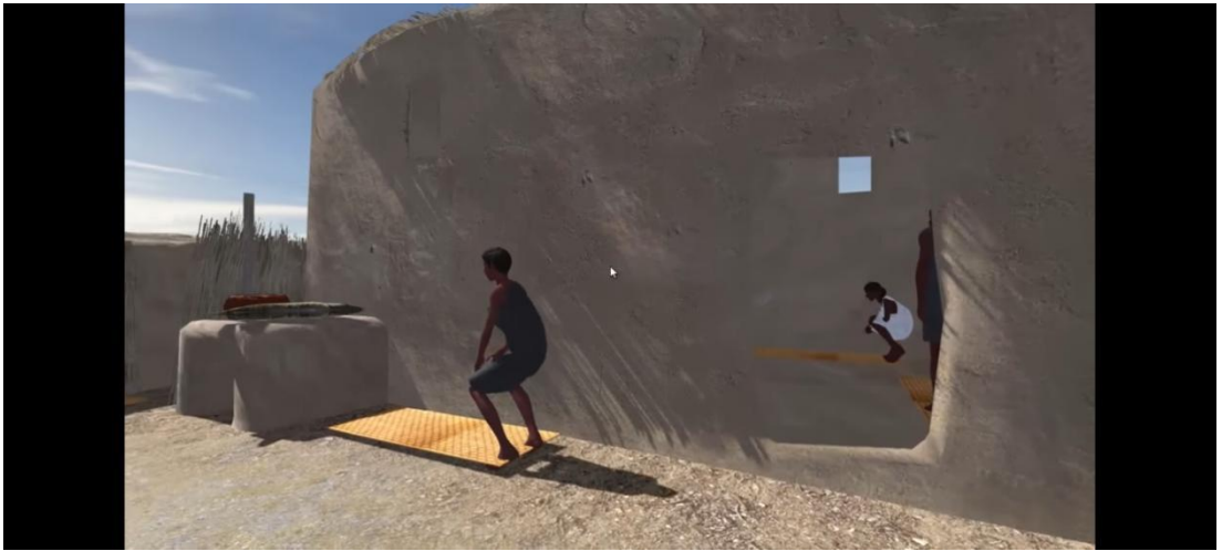
EK 2. Sidney Üniversitesi tarafından hazırlanan Uruk Dönemi'nde günlük yaşam isimli simülasyondan. ( https://www.youtube.com/watch?v=Z5HFQvx0u2c [Erişim 08.06.2022] )