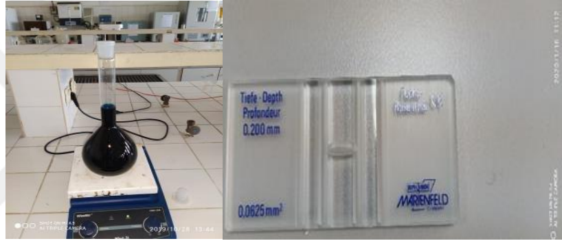
Şekil 3.9. Metil yeşil formalin çözeltisi ve Fuchs-Rosenthal