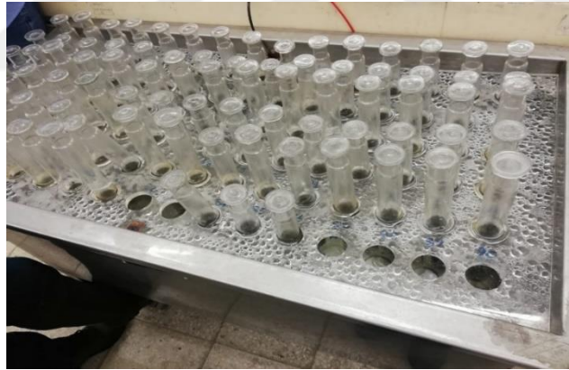
Şekil 3.6. İn vitro gaz üretimi

Toplam gaz üretiminin ölçülmesinde in vitro gaz üretim tekniği (Hohenheim) aşağıdaki detaylandırıldığı şekilde uygulanmıştır (Menke and Steingass, 1988). Yem örneği 1 mm'lik elekten geçecek şekilde öğütülmüş, yaklaşık 250 mg havada kuru yem maddesi (200 mg KM) tartılarak enjektörün dibine yerleştirilmiş ve enjektörün pistonları gaz kaçışını engellemek amacıyla ilk 2-3 cm'lik kısmı hariç vazelinle yağlanmıştır. Örnek miktarının sınırlı tutulması toplam gaz üretiminin 90 ml'yi aşmayacak şekilde ayarlanmak istenmesiyle ilgili olup gaz üretiminin 90 ml'yi aştığı durumlarda ise biriken gaz (sıvı kısım hariç) dışarı atılmıştır ve bu değer hesaplamalarda dikkate alınmıştır.