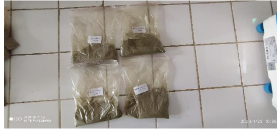
Şekil 3.2. Rasyonların muhafazası veya depolanması