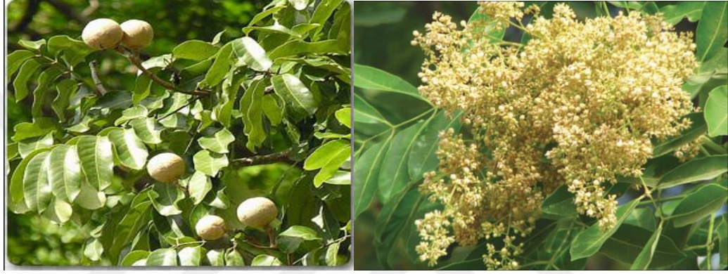
Şekil 2.4. Khaya senegalensis meyveleri, yaprakları ve çiçekleri

Nesli tükenmekte olan bir ağaç olan KS Uluslararası Doğa Koruma Birliği'nin (UDKB) koruması altındadır (Danthu et al., 1999). KS ağacının tohumları tıbbi amaçlarla ve köpek yemi olarak da kullanılmaktadır (Neya, 2006).