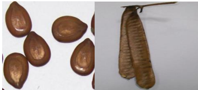
Şekil 2.3. LL tohumları ve kabukları