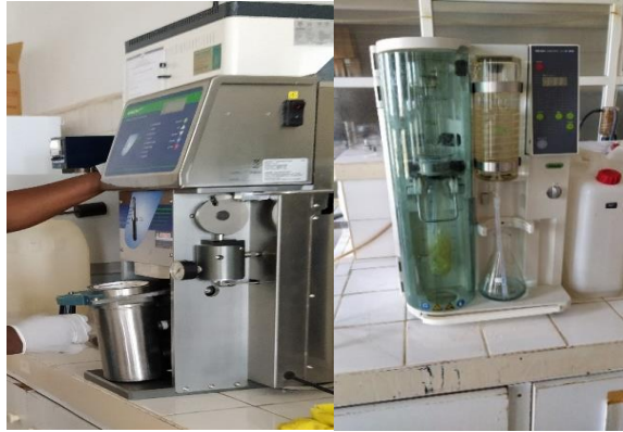
Şekil 3.4. HY ve HP analizleri