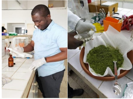
Şekil 5.1. Yağların (SY, FY) etanol ile karıştırılması ve yağ (SY, FY) + etanol karışımının rasyona eklenmesi

Mevcut çalışmada, erken (%40 Medicago sativa / %60 Karma yem ) ve orta (%60 Medicago sativa / %40 Karma yem) laktasyon dönemleri için iki farklı rasyon hazırlanmıştır. Rasyonlar hazırlandıktan sonra iki gruba ayrılmıştır. Birinci grupta nitrat (NaNO 3 ) kullanılmazken (üre kullanılmıştır), ikinci grupta başına %5 NaNO 3 /kg KM (45.94 g NaNO 3 /kg KM) kullanılmıştır. Rasyonlara iki bitkisel yağ kaynağı SY %4 (yani 36.58 g SY/kg KM) ve FY %4 (yani 36.58 g SY/kg KM) ) ilave edilmiştir. Rasyonların hazırlanması Şekil 5.1., 5.2., 5.3 ve 5.4.'te gösterilmiştir. Muamele gruplarının bileşimi ve rasyonların kimyasal kompozisyonu Tablo 5.1'de verilmiştir.