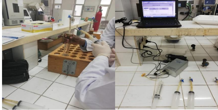
Şekil 3.7. CH 4 üretiminin belirlenmesi.