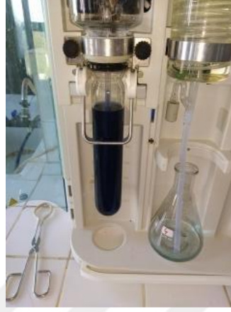
Şekil 3.8. İnkübasyonun 48 saatinde rumen sıvısında \text{NH}_3 miktarının belirlenmesi