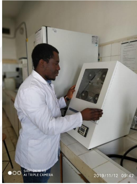
Şekil 3.5. Daisy inkübatörde sindirilebilirlik çalışması

Torbaların ve numunelerin hazırlanması: Çalışmamızda kullanılan F 57 filtre torbalarının daraları alındıktan (W 1 ) sonra 0.5 g numune (W 2 ) torbaya konulmuş ve torbaların ağzı sıcak mühürleme yardımıyla kapatılmıştır. Bu şekilde hazırlanan torbalar kavanozlara eşit oranda olacak şekilde yerleştirilmiştir Her bir kavanoza bir adet boş F 57 torbası (C 1 'in belirlenmesi amacı ile) yerleştirilmiştir. Daisy II inkübatöründe 48 saat bekletilen F 57 torbaları kavanozlardan çıkarılıp yıkandıktan sonra 3-5 dakika aseton içinde bekletilmiştir ve daha sonra tamamen havada kuru hale getirilmiştir.