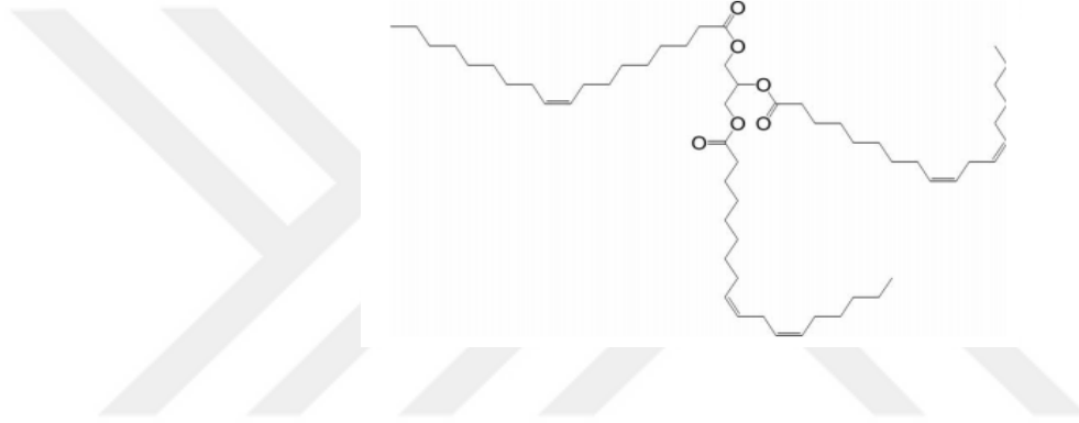
Şekil 2.1. SY yapısının şematik gösterimi (Petrović, Z. S., 2008)

Soya yağının yapısı şekil 2.1.'de gösterilmiştir.