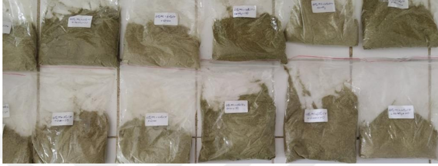
Şekil 5.4. Rasyonların muhafazası