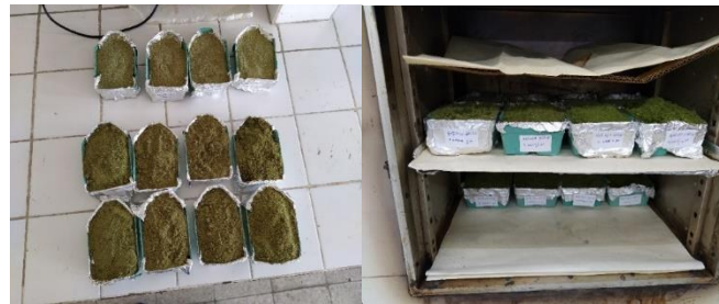
Şekil 5.2. Rasyonların depolanması ve etüvde (60°C) rasyonların 3 gün boyunca kurutulması