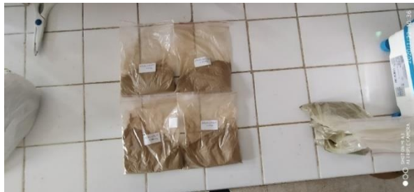
Şekil 4.2. Rasyonların muhafazası veya depolanması