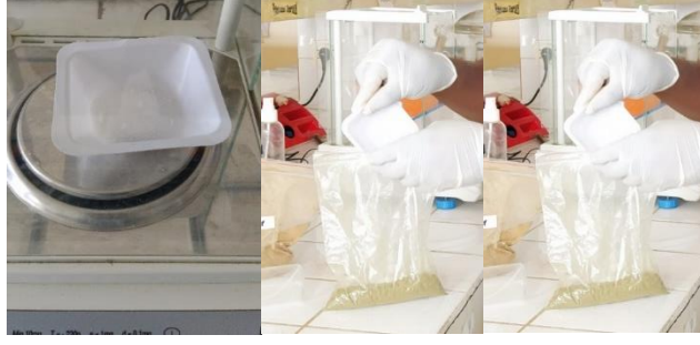
Şekil 5.3. Yem katkı maddelerinin (nitrat veya üre) tartılması ve rasyonlara karıştırılması