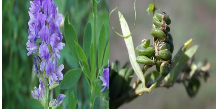
Şekil 2.5. Medicago sativa yaprakları, çiçekleri ve tohumları