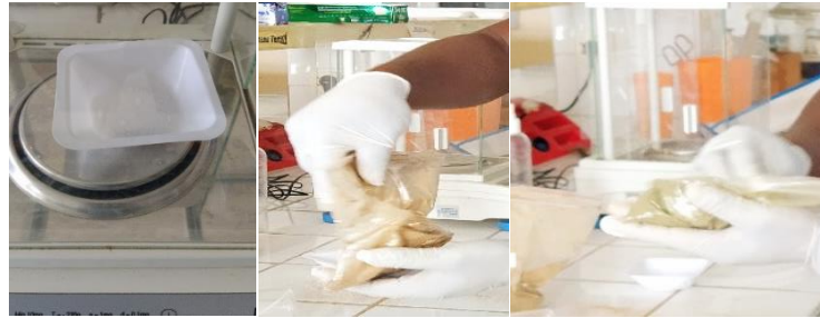
Şekil 4.1. Yem katkı maddelerin (Nitrat veya üre) tartılması ve rasyonlara karıştırılması

Mevcut çalışmada, erken (%40 Khaya senegalensis / %60 Karma yem) ve orta (%60 Khaya senegalensis / %40 Karma yem) laktasyon dönemleri için iki farklı rasyon hazırlanmıştır. Rasyonlar hazırlandıktan sonra iki gruba ayrılmıştır. Birinci grupta nitrat (NaNO 3 ) kullanılmazken (üre kullanılmıştır), ikinci grupta başına %5 NaNO 3 /kg KM (46.74 g NaNO 3 /kg KM) kullanılmıştır. Rasyonların hazırlanması Şekil 4.1. ve 4.2.'de gösterilmiştir. Muamele grupları ve kullanılan rasyonların kimyasal bileşimi Tablo 4.2'de verilmiştir.