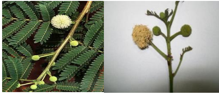
Şekil 2.2. LL yaprağı ve genç sürgünler

Tropik bölgelerde ruminant hayvanların beslenmesinde yaygın olarak kullanılan Leucaena leucocephala (LL) Fabaceae familyasına ait olup (Meena et al., 2013) protein, mineral ve karotence zengindir (Akingbade et al., 2001). Bu ağaç türü 4-8 yıl arasında, 18-37 cm çapa ve 18 m yüksekliğe ulaşabilmektedir (Pottinger ve Hughes, 1995). Tropik bir bitki türü olan LL yüksek sıcaklıklara (25-30°C) dayanıklıdır. LL'nin yaprakları, tohumları ve kabukları Şekil 2.2 ve 2.3'te sunulmuştur.