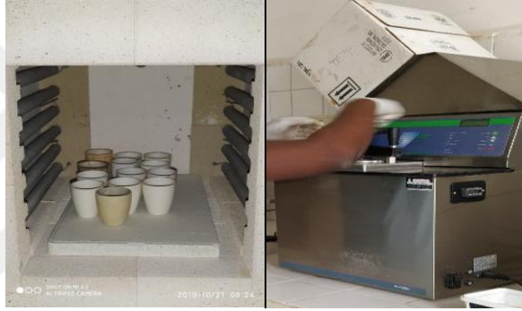
Şekil 3.3. HK, KM, NDF, ADF, ADL, ve HS analizleri

ADF (AOAC, 2000; yöntem 7.074), NDF (AOAC, 2000; yöntem 2002.04), HS (AOAC,2000; yöntem 992.09) analizleri ise Van Soest et al. (1991) tarafından bildirildiği gibi ANKOM 200 Fiber Analyzer (ANKOM Technology Corp. Fairport, NY, USA) cihazı kullanılarak yapılmıştır. HY içeriği (AOAC, 2000; yöntem 2003.05) ANKOM XT15 (ANKOM Technology Corp. Fairport, NY, USA) kullanılarak belirlenmiştir (Kutlu, 2008). OM, selüloz (SEL= NDF-(HSEL+ADL)), hemiselüloz (HSEL= NDF-ADF) ve lif olmayan karbonhidrat (LOK= 100 -(HP+HK+ADF+HY)), NÖM (NÖM= OM - (HY+HP+HS)) içerikleri hesaplanarak belirlenmiştir (Şekil 3.3 ve 3.4.).