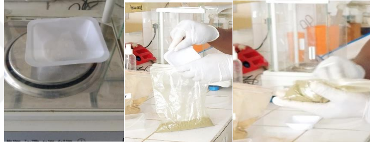
Şekil 3.1. Yem katkı maddelerinin (Nitrat veya üre) tartılması ve rasyonlara karıştırılması

Bu çalışmada, erken (%40 Leucaena leucocephala / %60 Karma yem) ve orta (%60 Leucaena leucocephala / %40 Karma yem) laktasyon aşamaları için iki farklı rasyon hazırlanmıştır. Hazırlanan rasyonlar iki gruba ayrılmıştır. Birinci grupta nitrat (NaNO 3 ) kullanılmazken (üre kullanılmıştır), ikinci grupta % 5 NaNO 3 (yani 45.67 g NaNO 3 /kg KM rasyon) kullanılmıştır. Rasyonların hazırlanması Şekil 3.1. ve 3.2.'de gösterilmiştir. Muamele gruplarının rasyon içeriği Tablo 3.3.'de verilmiştir.