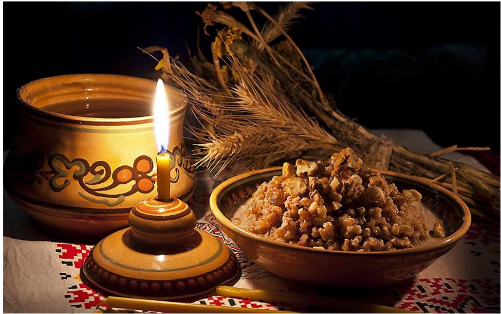
Fotoğraf 10: Anma günlerinde yapılan “kutya” adıyla bilinen törensel yemek