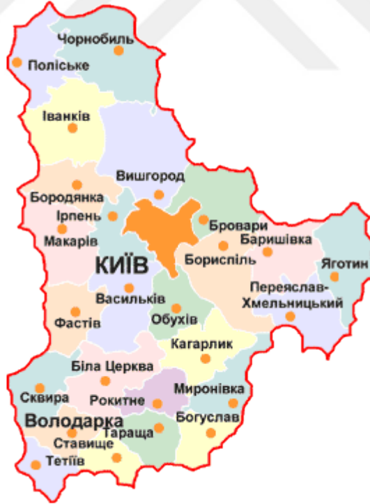
Harita 2: Kiyiv bölgesi