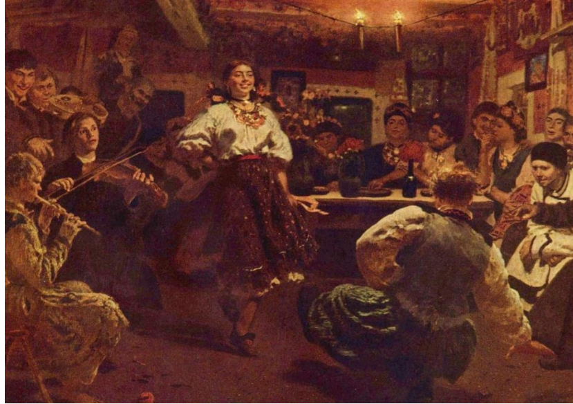
Fotoğraf 2: Gençler tarafından düzenlenen “veçornitsi” adıyla bilinen akşam eğlenceleri