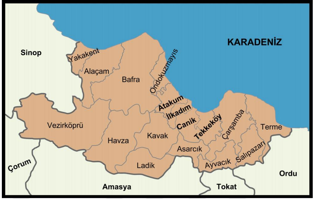
Harita 3: Samsun