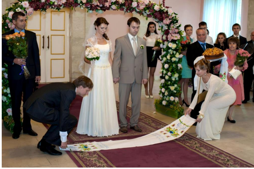
Fotoğraf 7: Nikâh sırasında nedime ve sağdıç tarafından geleneksel havlu açılması