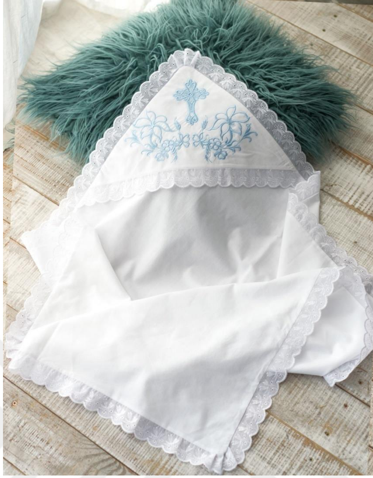
Fotoğraf 9: Vaftiz için vaftiz annesi tarafından alınan “krijmo” adıyla bilinen kumaş parçasıdır