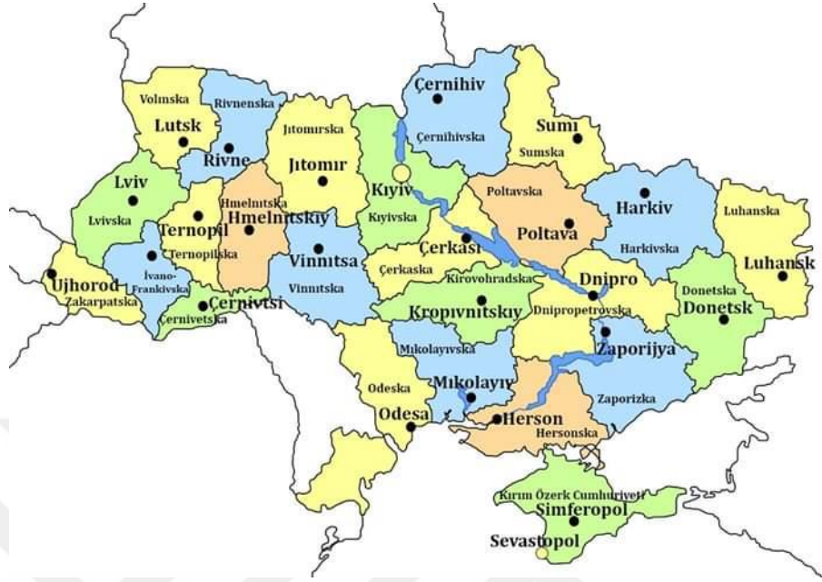
Harita 1: Ukrayna haritası