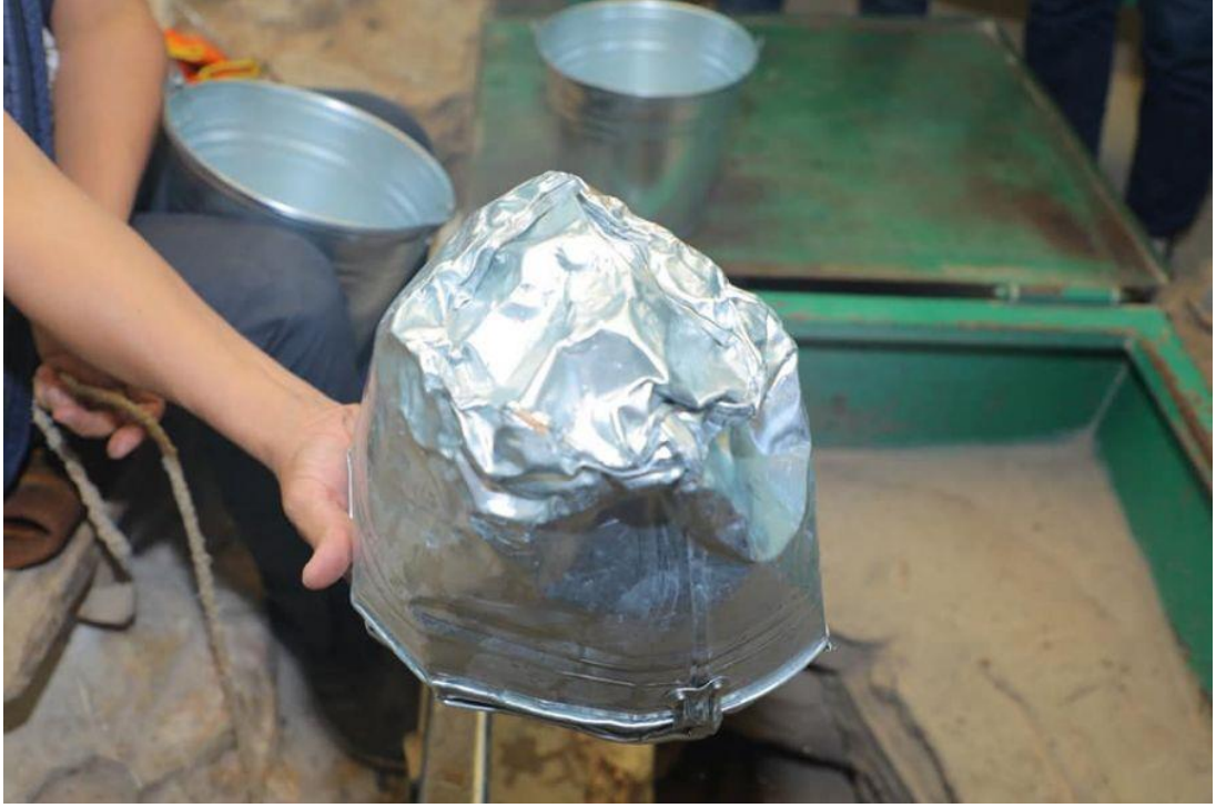
Kuyudan ziyaretçiler su almakta ve su alabiliyorsa günahsız olduklarına inanmakta, bazı kovalar resimdeki gibi yıpranmış bir şekilde dönmektedir