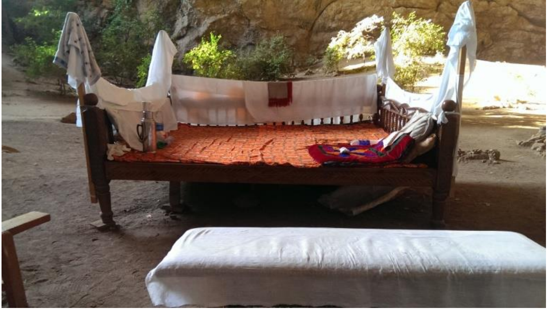
Akmeşit Mağarası içerisindeki ziyaretçilere anlatma, Kur'an bağışlama ve benzeri işlerde yardımcı olması için bulunan din adamının oturduğu yer