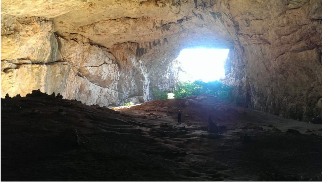
Akmeşit Mağarası. İç tarafı görünüşü