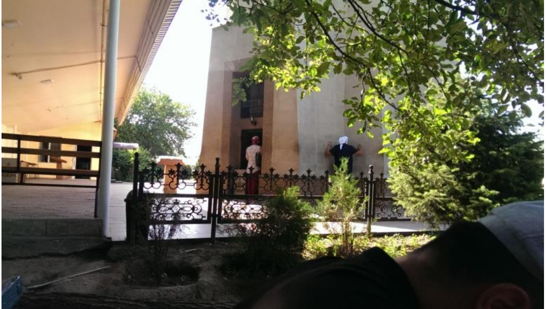
Rayimbek Ata Türbesi ve duvarına elleriyle dokunarak ritüelde bulunan ziyaretçi kadın