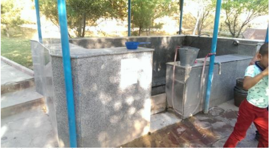
Domalak Ana Türbesi etrafındaki pınar. Ziyaretçiler pınar suyunda yıkanır, kendileriyle götürürler, suyun şifalı olduğuna inanırlar.