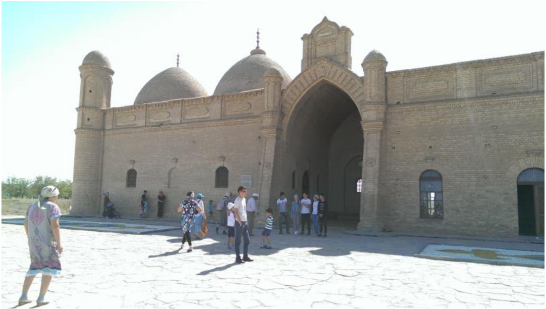
Aristan Bab Türbesi ve ziyaretçiler