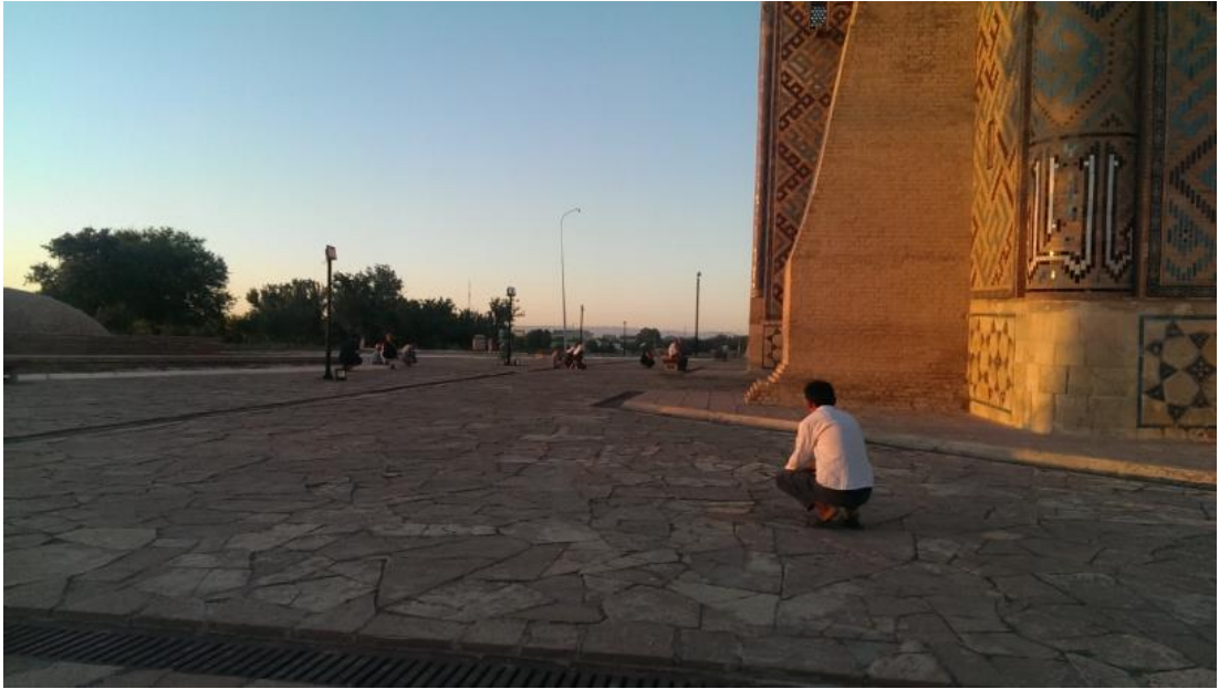
Hoca Ahmed Yesevi Türbesinde Kur'an okunduğu zaman ziyaretçiler saygıyla olduğu yerde tizüstü oturmakta