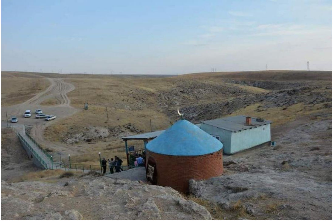
Ukaşa Ata Kuyusu, uzaktan görünüşü