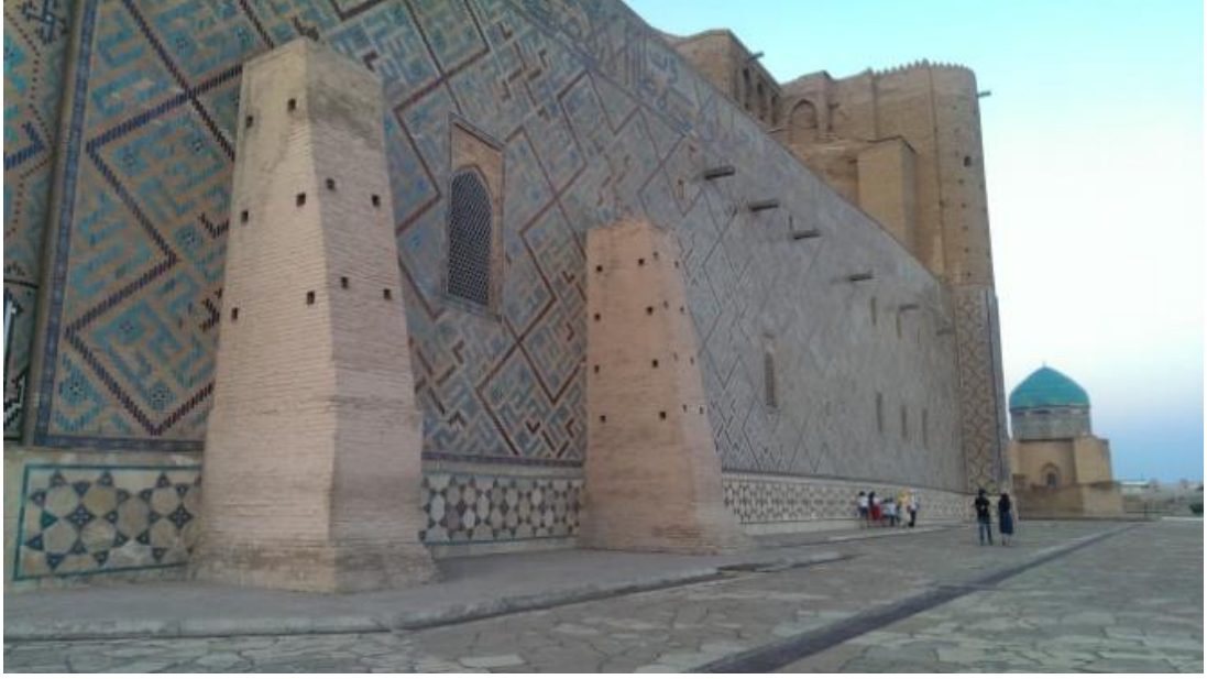
Hoca Ahmed Yesevi Türbesini dokunarak dönmekte olan ziyaretçiler, çocuklar da anne babalarının yaptıklarını tekrarlamaktalar