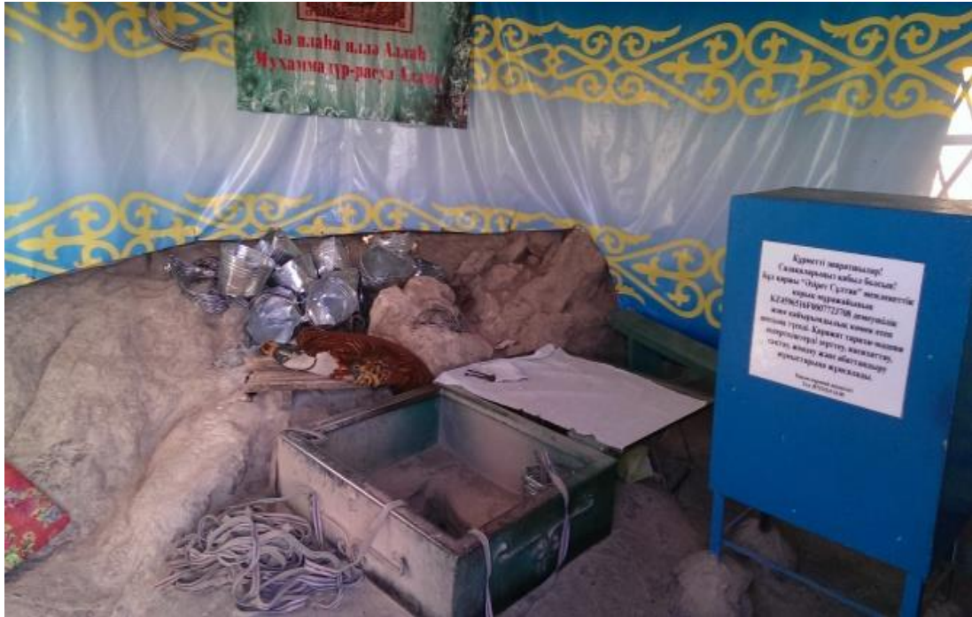
Ukaşa Ata Kuyusunun yakından görünüşü