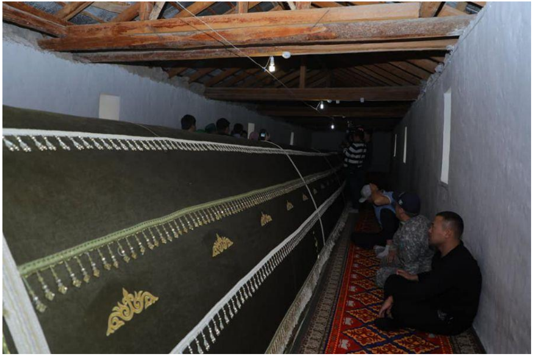
Ukaşa Ata Türbesi ve kabri