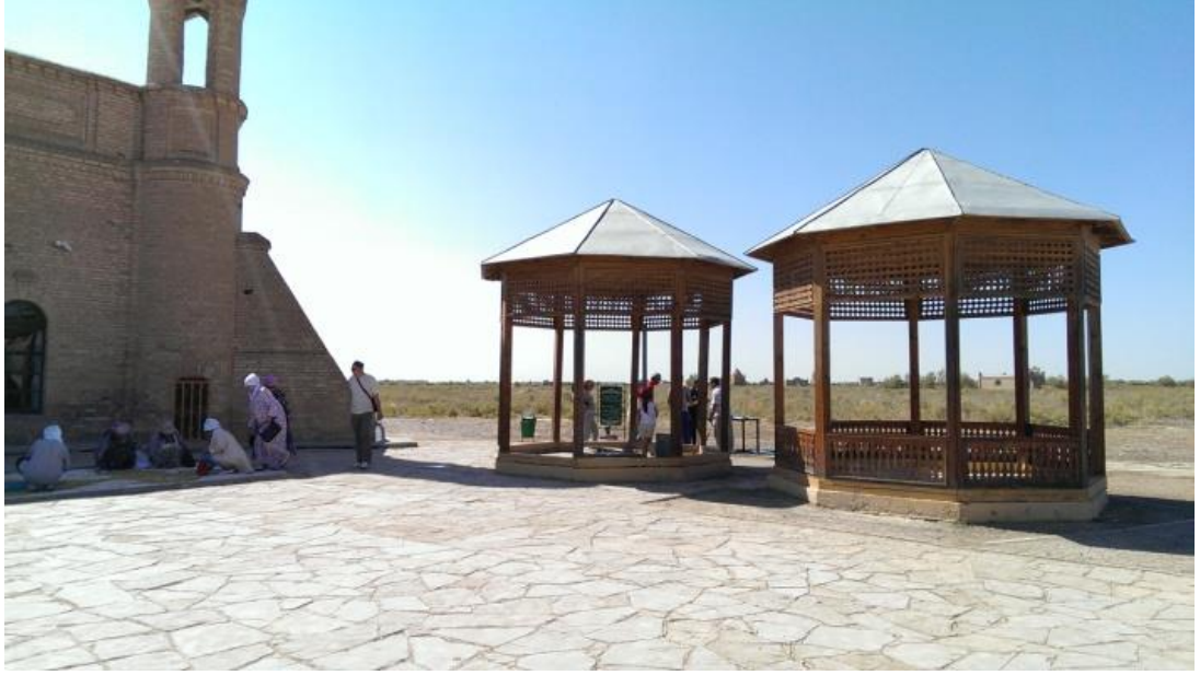
Aristan Bab Türbesi önündeki kuyu ve kuyudan su alan insanlar. Ziyaretçiler kuyu suyunun sağlık için faydalı olduğuna inanmaktalar (kuyu suyu aşırı tuzlu).