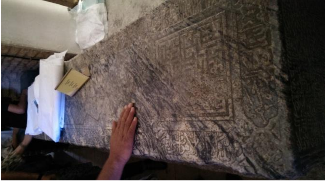
Hoca Ahmed Yesevi Türbesi içeriğindeki mezar taşlarına dokunmakta olan ziyaretçiler