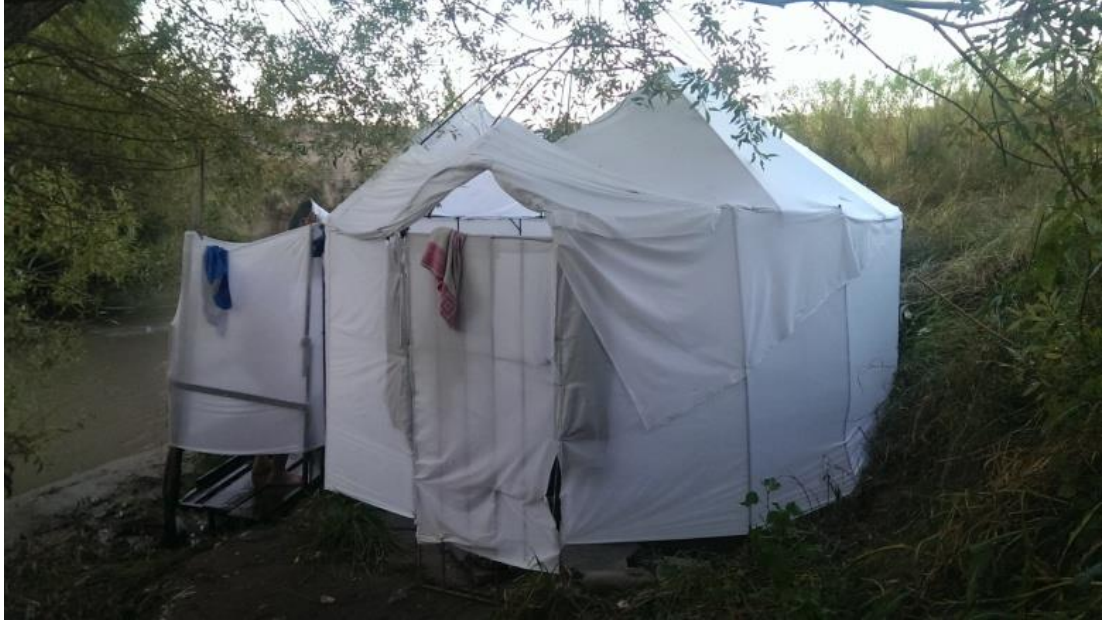
Almerek Ata Pınarı suyuyla yıkanmak için ziyaretçilerin kurduğu çadır.