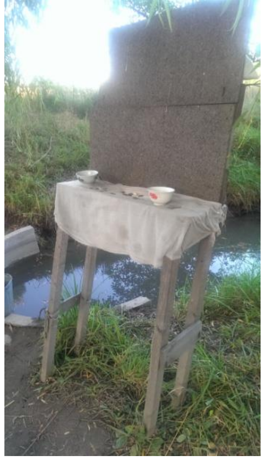
Almerek Ata Pınarı (Almerek Ata Türbesinin yakınında bulunmaktadır) ve pınarın etrafına ziyaretçilerce bırakılan paralar. Ziyaretçiler pınar suyunun şifalı olduğuna inanır.