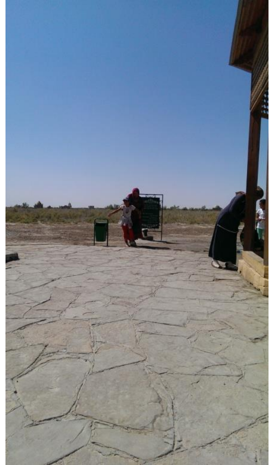
Aristan Bab Türbesi önündeki kuyunun yakından görünüşü Annesi kovadaki kalan suyu üzerine aniden döküvermesine ağlayan kız çocuğu