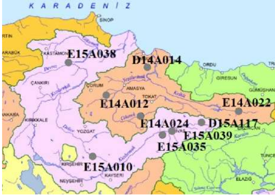
Şekil 1 - Yeşilirmak ve Kızılırmak Havzası

seçilen Şekil 1' de gösterilen 9 istasyonun genel özellikleri Çizelge 1' de, akım verilerinin mevsimsel ve yıllık istatistiksel özellikleri ise Çizelge 2' de gösterilmektedir. Örnek olarak Kızılırmak havzasındaki Yeşilhisar istasyonunun yağış alanı 1825 km 2 olup, ortalama debisi 2,6 m 3 /s'dir. En çok debiye sahip Söğütluhan istasyonunun ortalama debisi 34,9 m 3 /s'dir. Bu çalışmada, yıllık NAO ve AO indeks değerleri, yıl içerisindeki 12 aya ait indeks değerlerinin ortalaması alınarak bulunmuş olup mevsimsel NAO ve AO indeks değerleri ise o mevsime ait ayların indeks değerlerinin ortalamaları alınarak hesaplanmıştır. NAO ve AO indeks değerleri, Ulusal Okyanus ve Atmosferik Yönetimi (NOAA) İklim Tahmin Merkezi (CPC) tarafından sağlanmıştır [CPCNW, 2019]. İndekslere ait istatistiksel bilgiler Çizelge 3' de gösterilmiştir.