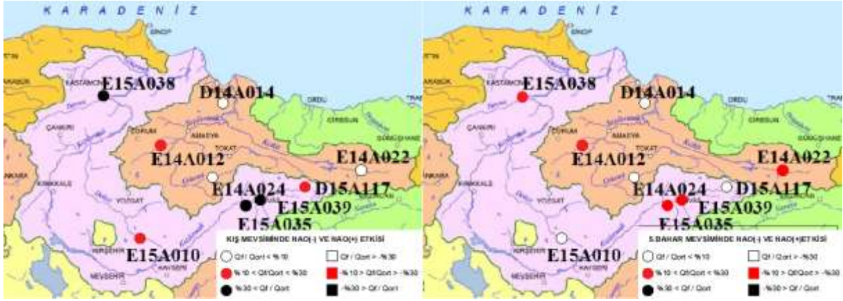
Şekil 2 - Kış(sol) ve sonbahar(sağ) mevsiminde NAO(-) ve NAO(+) indeksinin akımlar üzerindeki etkisi

mevsimsel öteleme etkisinin ilkbahar-yaz için Yeşilirmak havzasında daha belirgin olduğu söylenebilir.