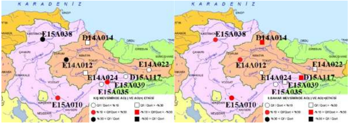
Şekil 3 - Kış(sol) ve sonbahar(sağ) mevsiminde AO(-) ve AO(+) indeksinin akımlar üzerindeki etkisi