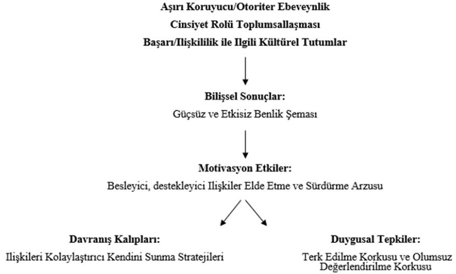
Şekil 2.2. Bilişsel/Etkileşimsel (B/E) Kişiler Arası Bağımlılık Modeli (The Cognitive/Interactionist (C/I) Model of Interpersonal Dependency).

Kişinin bilişleri ve neden olduğu diğerlerine yönelik etkileşimlerin bileşimi olan model bu nedenle bilişsel-etkileşimci ismiyle kavramsallaştırılmaktadır (Bornstein, 2006; Bornstein, 2011).