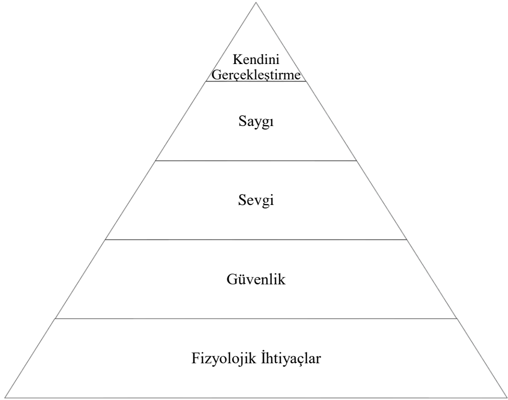
Şekil 2.1. Maslow'un İhtiyaçlar Hiyerarşisi (Schultz ve Schultz, 2006,5; Akt. Kaleli, 2019).

gerçekleştirebilmemiz için alt basamaklardaki ihtiyaçlarımızın tamamlanması gerektiğini savunmuştur (Burger, 2006; Akt. Kaleli, 2019). Söz konusu hiyerarşi Şekil 2.1’de gösterilmiştir.