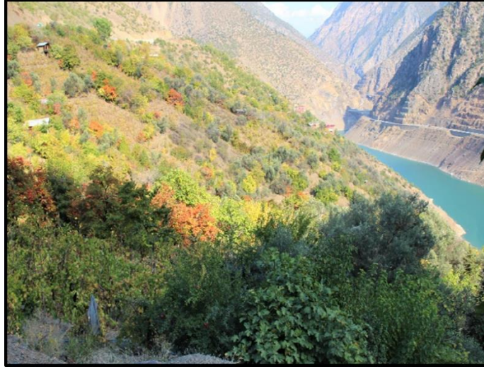
Fotoğraf 1: Güverda Bağlarının Batı Yönünden Kuzeydoğu Yönüne Görünümü (29 Ekim, 2019)

Güverda bağlarının sulama suyu, kaynağını Karçal Dağları'ndan alan ve araştırma sahasına en yakın akarsu olan Ortaköy Deresi'nden sağlanmaktadır. Jeolojik yapıyı oluşturan formasyonların andezit, bazalt gibi geçirimsiz kayalardan oluşmasının etkisiyle yüzey suları yeraltına inememekte, yağmur suları yüzeysel akışa geçmektedir. Mevcut kaynak sularının sıcak dönemlerde azalması ve kurumması nedeniyle yeraltı su kaynaklarından sulamada yeterince yararlanılamamaktadır.