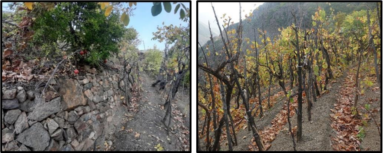
Fotoğraf 3-4: Güverda Bağlarında Taş Duvarların Üst Üste Yığılmasıyla Oluşturulan Hendek Ve Asmaların Sıralı Halde Dikildiği Evlekler

İkinci yöntem ise ağaçların dikildiği, eğim yönüne dik ve birbirine paralel oluşturan evlekler dir (Fotoğraf:4). Her iki şekilde arazinin taraçalandırılması aynı zamanda yıllık ekilip hasat edilen tarla bitkileri yerine, köklerinin toprak tutuculuğu daha fazla olan meyve ağaçlarının dikilmesini gerekli kılmıştır. Derin sürüm gerektiren bitkiler yerine toprak tutucu özelliği olan kök yapısına sahip bitkilerin yetiştirilmesi ile erozyonun bir ölçüde önlenmesi sağlanmıştır. Asma gövdesi ve yanlarına çakılan kuru ağaç dallarının yan yana sıralı halde evlek sırtı boyunca yer almaları sulama ve yağışlar esnasında toprağın sürüklenmesini azaltmış olmaktadır. Meyve ağaçları sayesinde, ekili alanlarda olduğu gibi tarlaların sürülmesine gerek kalmamakta, bahar aylarında taraçalar ve ağaç kökleri çapa ile düzeltilmektedir.