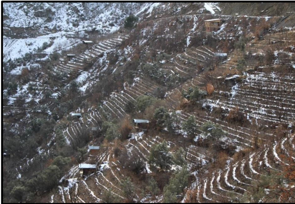
Fotoğraf 2: Güverda Bağlarında Taraçalandırılmış Yamaçlar (26 Ocak, 2020)