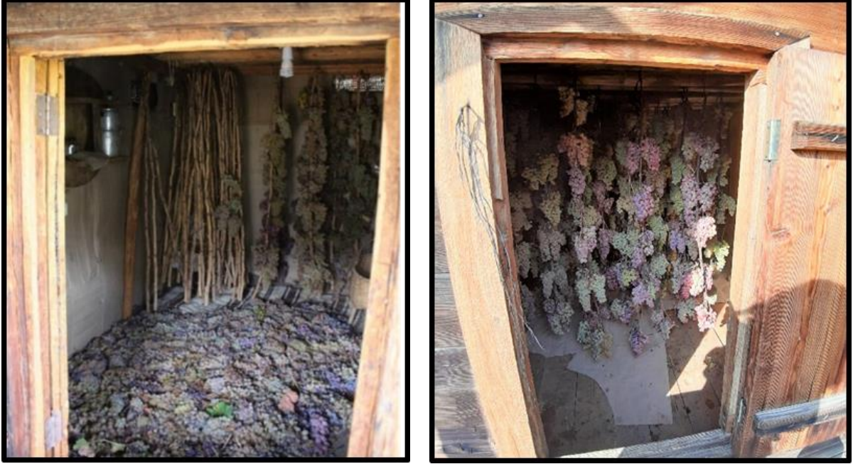
Fotoğraf 9: Üzüm (Bağ) Ambarlarının İçi: Salkımların Asılarak Ve Serilerek Ambara Konulması

Üzümün muhafaza şekli, cinsinin özelliklerine göre değişmektedir. Örneğin, döşemelik üzümün özelliği dayanıklı, kalın ve sert kabuklu oluşlarıdır. Bunların belli başlıları tütünü, bulgarı, keçimemesi, zoruktar, eldaş, ırazgı (rezzakı) gibi türlerdir. Heveklik olarak iğde dallarına asılıp bütün kış hatta bahara kadar yenebilen üzümün başta gelen özellikleri de salkımının seyrek ve tanelerinin dayanıklı, iri oluşudur. Bu özellikleri taşıyan üzümün başında genel olarak buludu denilen fakat siyahı beyazı ve bulut renklisi de bulunan cins ile dirmit , karalık ve parmak üzümü sayılabilir. Bu sayılan türler Kayseri bağlarında en çok yetiştirilen hâkim cins üzümlerdir. Üzümler, bağların budanmasına kadar, aristag denilen ve tokananın serin bölümünü teşkil eden yerde veya zerzemmi denilen bodrum katlarında muhafaza edilmiştir (Erkiletlioğlu, 2017: 60)