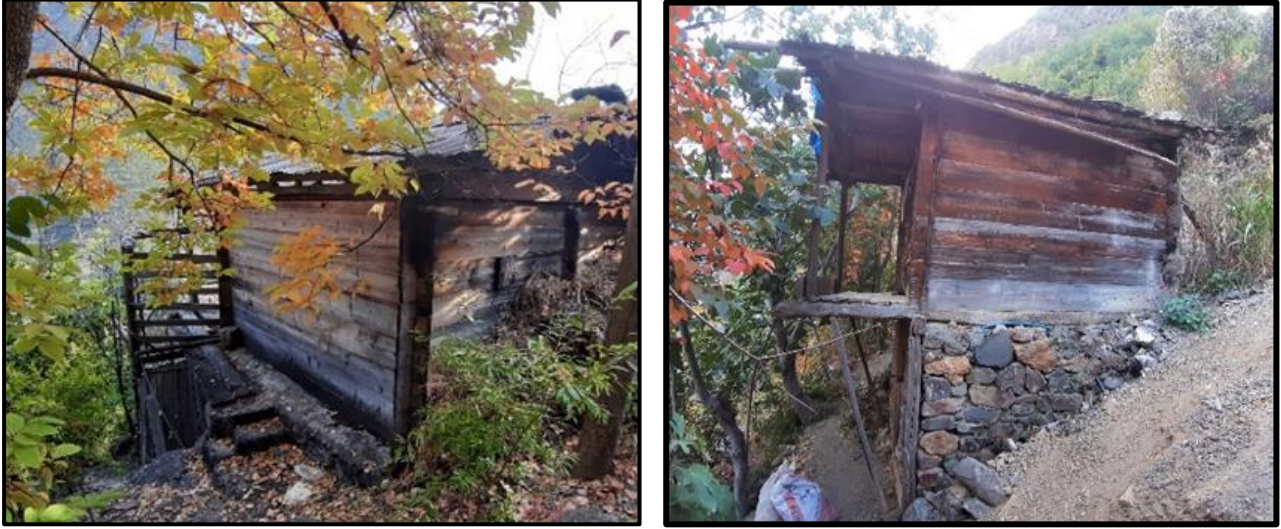
Fotoğraf 8: Güverda Bağlarında Bulunan Bağ Ambarları (29 Ekim, 2019)

edilmesinde bağ ambarı önemli işleve sahiptir. Ambarlar, 25-30 yıl kadar öncesinde bağlığın köy yerleşmelerine uzaklığı nedeniyle konaklama ihtiyacını karşılama ve gündelik işler sırasında dinlenme yeri olarak da kullanılmıştır.