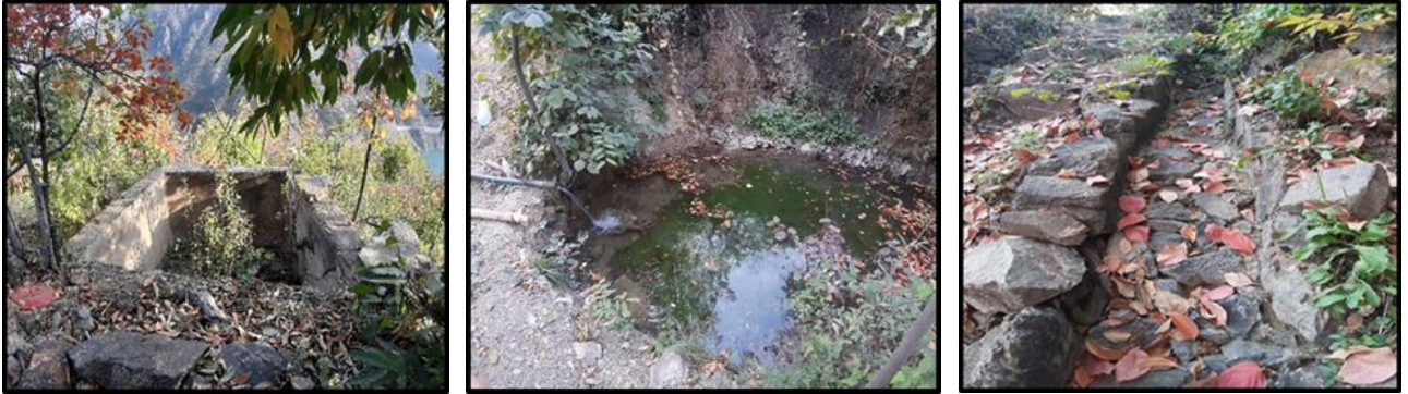
Fotoğraf: 5-6-7: Güverda Bağlarında Su Havuzu, Gölet ve Su Kanalı

Bağın sulanması mayıs ayının son haftasında başlamakta hasadın başlamasından yaklaşık 2-3 hafta öncesine kadar devam etmektedir. Ana sulama kanalı bağlığın üst tarafından geçirilmiş ve buradan her bahçeye sulama arkaları ayrılmıştır. Bahçeler içinde yapılan beton havuzların dışında, bağlık çevresindeki kaynak sularıyla oluşturulan göletler sulamada yararlanılmaktadır (Fotoğraf:5-6-7). Bağlarda su kaynaklarının az olmasına karşın bağcılar sulama sırası yapma, göletler ve havuzlar ile suyu depolama ve dayanışma içinde olarak meyve yetiştiriciliğini verimli şekilde yapmaya çalışmaktadır.