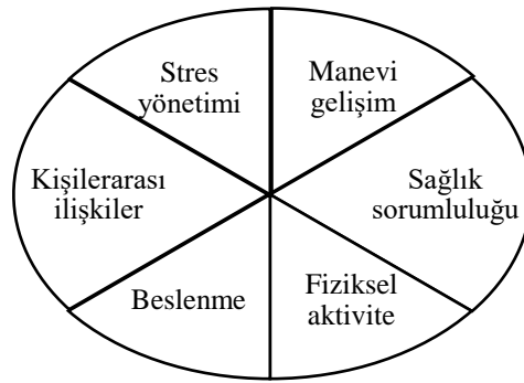
Şekil 2.1. Sağlıklı Yaşam Biçimi Davranışları Alt Boyutları (Balıkcı, 2017)

Wang ve ark. (2017) Amerikalı yetişkinler ile yaptıkları çalışmada, bireylerin 4 riskli sağlık davranışının (sağlıksız beslenme, aşırı fiziksel aktivite, sigara ve alkol) tip 2 diyabet gelişmesinde önemli derecede etkisi olduğunu belirlemiştir (Wang ve ark., 2017). Whatnall ve ark. (2016) genç kadınların fiziksel aktivite miktarını arttırmasının kardiyovasküler hastalıkların önlenmesinde yararlı olabileceği sonucuna ulaşmıştır (Whatnall ve ark., 2016). Buna göre literatür sonuçlarına bakılarak sağlıklı yaşam biçimi davranışlarının yerine getirilmesinin insanların yaşam kalitesinin artmasında çok önemli olduğu sonucuna ulaşılabilir. Pender'e göre sağlıklı yaşam biçimi davranışları kişilerarası ilişkiler, sağlık sorumluluğu, beslenme, fiziksel aktivite, stres yönetimi ve manevi gelişimdir (Bahar ve ark., 2008). Şekil 2.1'de sağlıklı yaşam biçimi davranışlarını oluşturan alt boyutlar gösterilmiştir.