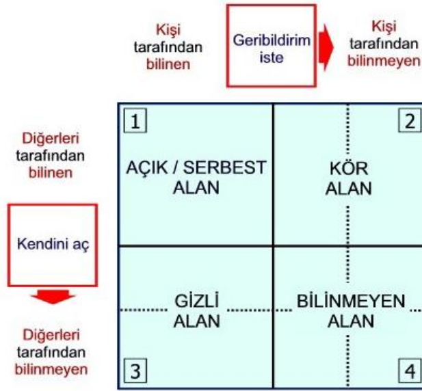
Şekil 2.1. Johari Penceresi ( https://fundakoca.medium.com )

Psikolojik yardım alma sürecinde önemli bileşenlerden biri de danışmana güvendir. Bu süreç danışan ile psikolojik danışman ya da psikolog arasındaki karşılıklı güven ve kabulü içermektedir. Güven ortamının oluşturulması, bireyin psikolojik yardım sürecinde kendini ifade etmesini kolaylaştırmaktadır (Zeren, 2017).